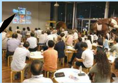
象の鼻テラスでの座学の様子