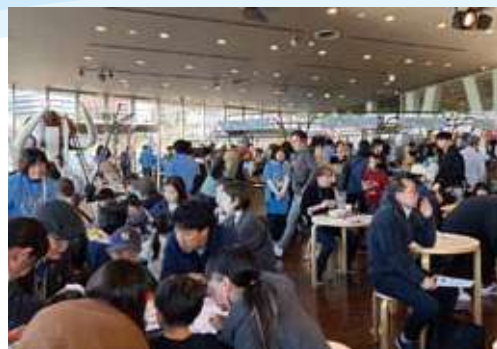
2025年3月、海辺の文化祭