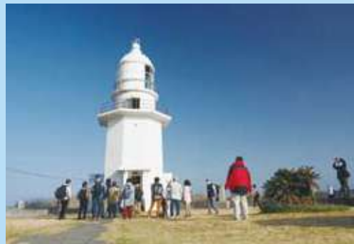
アクティビティ(剱埼灯台見学)